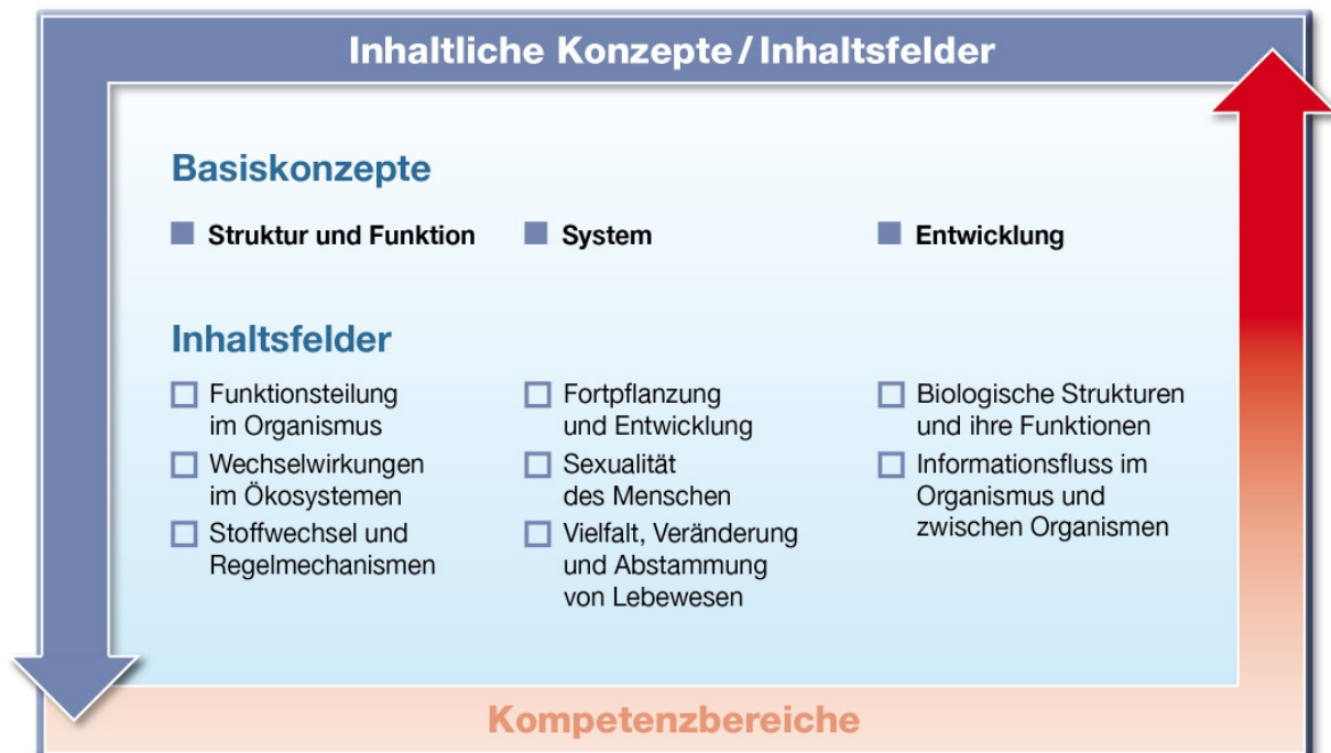
Abb. 2: Vernetzung der Kompetenzbereiche, Basiskonzepte und Inhaltsfelder

Die Breite der Fachwissenschaft Biologie mit ihrer ungeheuren Vielfalt und großen Anzahl von Einzelphänomenen zeigt in den letzten Jahrzehnten eine rasante Dynamik. In dieser Faktenfülle muss eine einsichtige Struktur geschaffen werden, die einerseits den Kern des biologischen Wissens repräsentiert und andererseits kumulatives Lernen arrangiert. Sie soll es dem Schüler ermöglichen, einmal Erkanntes auch auf neue Probleme zu übertragen. Im Unterricht ist daher exemplarisches Vorgehen notwendig, das vom Einfachen zum Komplexen hinleitet. Dies gelingt mit lebensweltlichen und sinnstiftenden Kontexten. Die Basiskonzepte vermitteln dazu nur einen Rahmen, in dem die in sich vernetzten Inhaltsfelder aufgehängt sind, sodass aus verschiedenen Kontexten heraus immer wieder Bezüge hergestellt werden können. Die Inhaltsfelder selbst beschreiben thematische Zusammenhänge, die sich einerseits aus dem biologischen Fachwissen ergeben, andererseits auf Fakten basieren, die man kennen muss, um sachgerecht eigene Lebenssituationen oder gesellschaftliche Fragen beurteilen und bewerten zu können. Die Basiskonzepte sind demzufolge themenverbindende übergeordnete Regeln, Prinzipien und Erklärungsmuster, die eine Vielzahl von unterschiedlichen Phänomenen miteinander vernetzen und sich im Laufe der gesamten Lernzeit zuerst herauskristallisieren und dann verknüpfen.