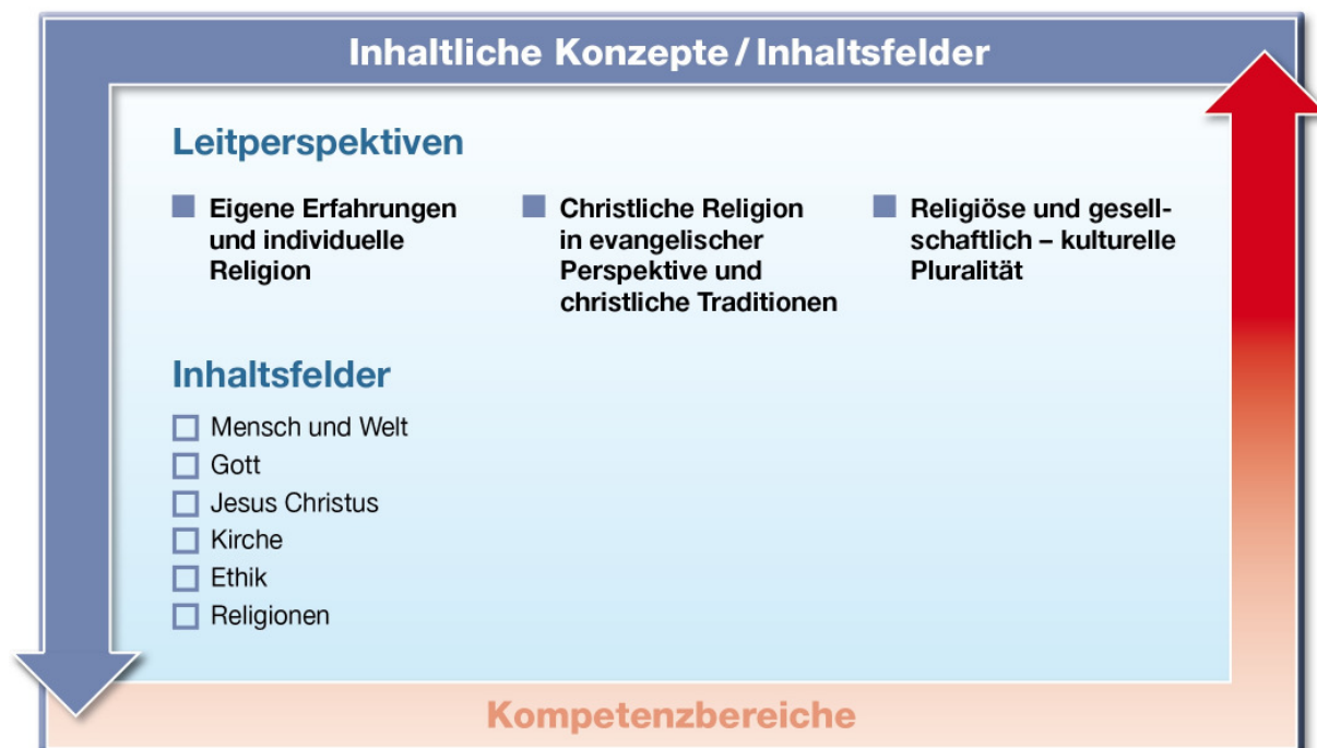
Abb. 2: Leitperspektiven und Inhaltsfelder im Fach Evangelische Religion

Für das Fach Evangelische Religion sind drei Leitperspektiven grundlegend, die abbilden, wie uns Religion in der Lebenswirklichkeit begegnet: