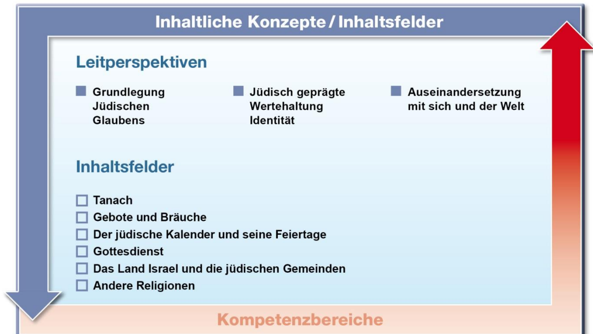
Abb. 2: Leitperspektiven und Inhaltsfelder

Die Leitperspektiven stellen inhaltliche Konzepte dar, die sich auf die Systematik des Faches beziehen und das gesamte Spektrum der Wissens Elemente durchdringen. Die drei Leitperspektiven entfalten wechselseitig sechs Inhaltsfelder, die die unverzichtbaren Wissensbestände des Faches darstellen.