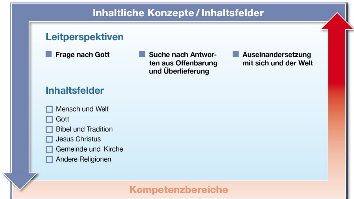
Abb. 2: Leitperspektiven und Inhaltsfelder

Die Inhaltsfelder richten sich an den Leitperspektiven des Faches aus und erschließen sie inhaltlich. Diese Leitperspektiven „Frage nach Gott“, „Suche nach Antworten aus Offenbarung und Überlieferung“ und „Auseinandersetzung mit sich und der Welt“ stellen inhaltliche Konzepte dar, die sich auf die Systematik des Faches beziehen und das gesamte Spektrum der Wissens Elemente durchdringen. Die drei Leitperspektiven entfalten wechselseitig sechs Inhaltsfelder, die die unverzichtbaren Wissensbestände des Faches darstellen. Die fachlichen Beziehungen werden durch den Konzeptgedanken über die Primarstufe hinaus bis in die Sekundarstufe I als roter Faden deutlich.