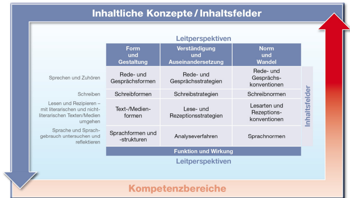
Abb. 2: Leitperspektiven, Inhaltsfelder und Kompetenzbereiche des Faches Deutsch