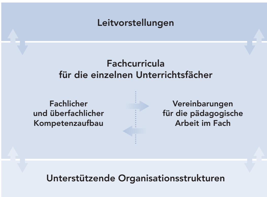
Abb. 1: Elemente des Schulcurriculums

Die schulinterne curriculare Entwicklungs- und Planungsarbeit hat das Ziel, das neue Kerncurriculum für Hessen in Form von Fachcurricula zu konkretisieren. Die Aufgabe der Fachkonferenzen bzw. Planungsgruppen in den einzelnen Schulen besteht darin, sich über die Leitlinien pädagogischen Handelns und den Kompetenzaufbau in den einzelnen Fächern – aber auch über die Fächergrenzen hinweg – zu verständigen, Vereinbarungen darüber herbeizuführen und diese zu dokumentieren. Die Fachcurricula sind die wesentlichen Elemente eines Schulcurriculums 1 .