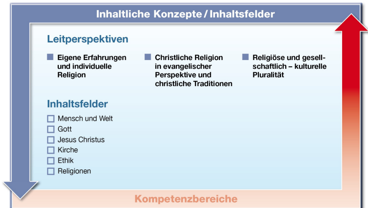
Abb. 2: Leitperspektiven und Inhaltsfelder im Fach Evangelische Religion

Für das Fach Evangelische Religion sind drei Leitperspektiven grundlegend, die abbilden, wie uns Religion in der Lebenswirklichkeit begegnet: