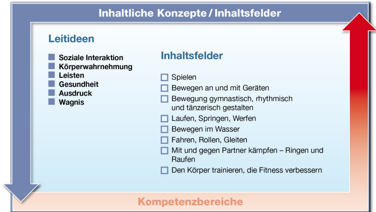
Abb. 2: Leitideen und Inhaltsfelder

Die im Folgenden ausgeführten sechs Leitideen stellen die verbindliche inhaltliche Grundlage und Ausrichtung des Sportunterrichts dar. Die Inhaltsfelder lassen sich so in eine übergeordnete Struktur einbinden.