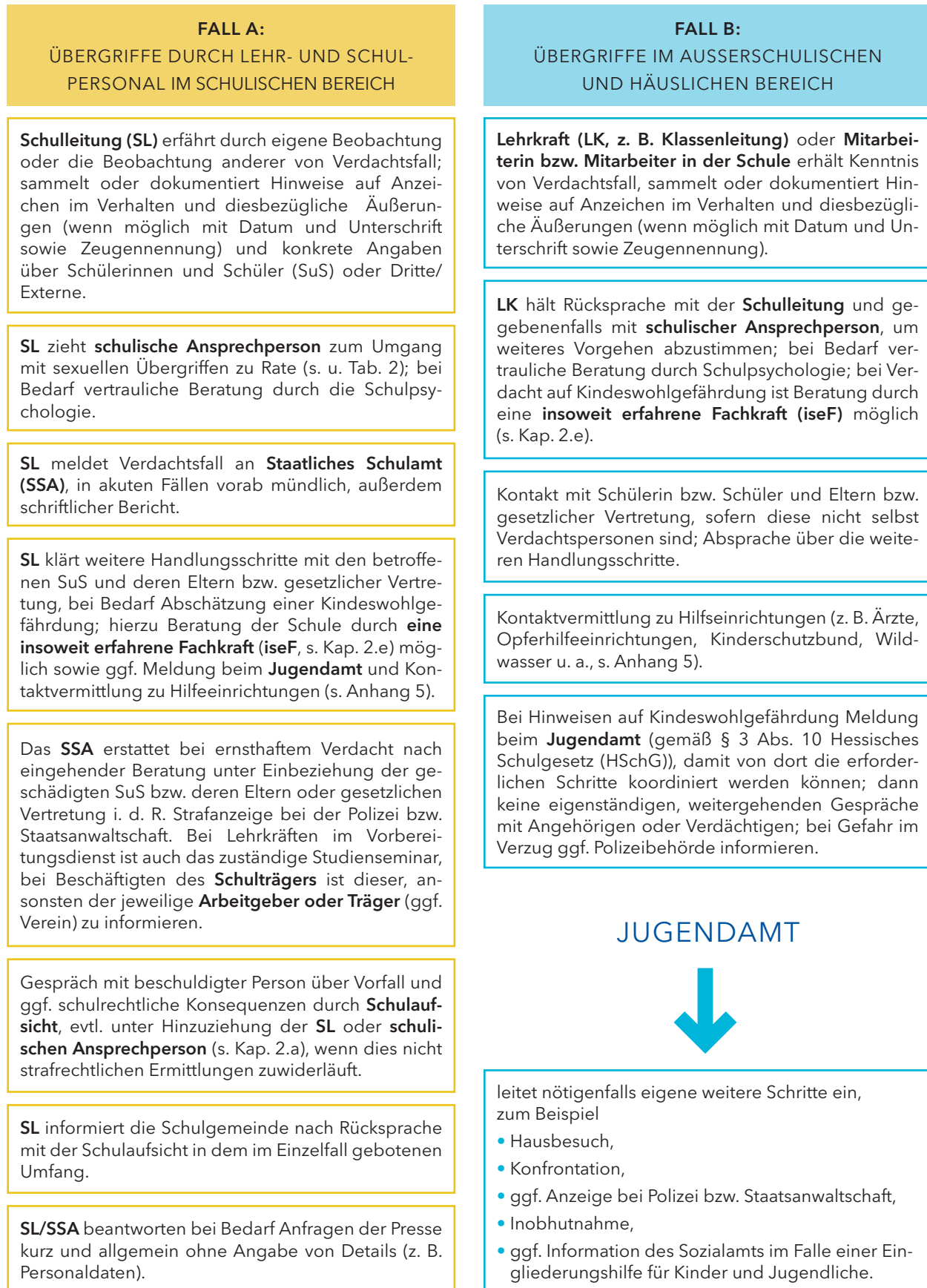
ABB. 1: SCHULISCHE MASSNAHMEN BEI VERDACHT AUF SEXUELLE ÜBERGRIFFE