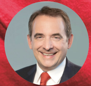
Prof. Dr. R. Alexander Lorz Hessischer Kultusminister